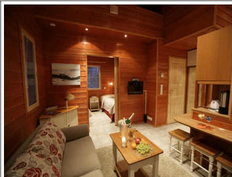
Intérieur du chalet