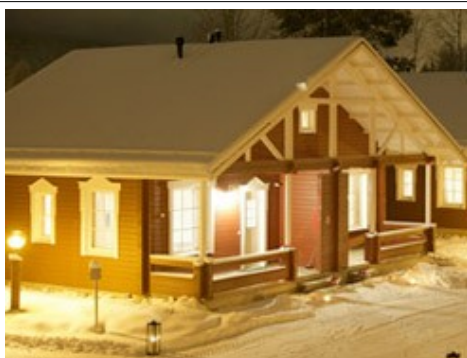
Vue Extérieur du chalet